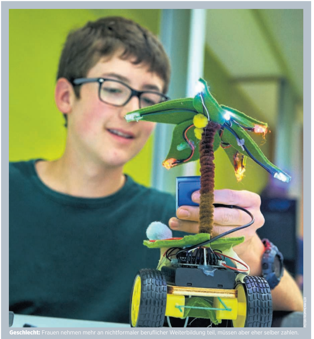
Geschlecht: Frauen nehmen mehr an nichtformaler beruflicher Weiterbildung teil, müssen aber eher selber zahlen.